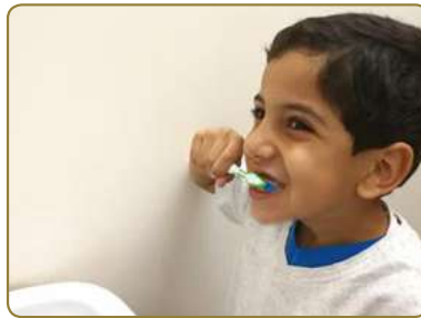
تُنَظِّفُ أَسْنَانَكَ بِالْفَرْشَاةِ وَالْمَعْجُونِ