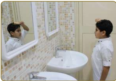
تَسْرِيحُ الشَّعْرِ وَالْعِنَايَةَ بِهِ