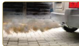
لَا نُلَوِّثُ الهَوَاءَ