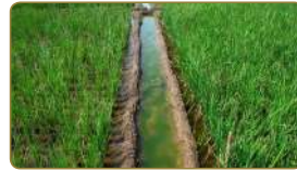
نَرْوِي النَّبَاتَ وَنَرْعَاهُ