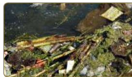
لَا نَرْمِي المَخْلَفَاتِ فِي المِيَاهِ