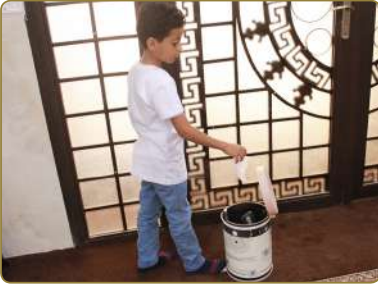
نَضَعُ النِّفَايَاتِ فِي مَكَانِهَا الْمَخْصُصِ

كَيْفَ نَحَافِظُ عَلَى مَلَابِسِنَا ، وَالْأَمَاكِنِ الَّتِي نَسْتَخْدِمُهَا ، أَوْ نَعِيشُ فِيهَا؟