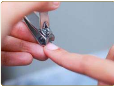
قَصُّ الْأَظْفَارِ إِذَا طَالَتْ

وَلَكِي تُحَافِظَ عَلَى نِظَافَةِ جِسْمِكَ قُمْ بِمَا يَأْتِي: