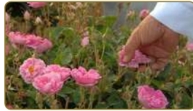
لَا نَقْطِفُ الزُّهُورَ