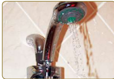
الِاغْتِسَالُ خَاصَّةً يَوْمَ الْجُمُعَةِ