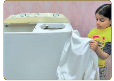
نَغْسِلُ الْمَلَابِسَ الْمُسَخَّةَ