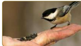
نَرْفِقُ بِالْحَيَوَانَاتِ وَنَرْعَاهَا