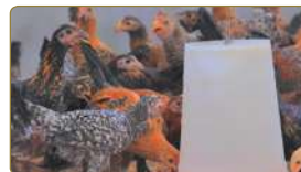
نَسْقِي الطُّيُورَ وَنَرْحَمُهَا