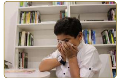
تَنْظِيفُ أَنْفِكَ بِالْمُنْدِيلِ