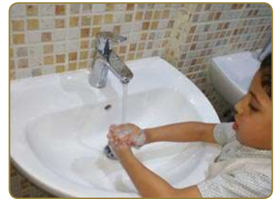
تَغْسِلُ يَدَيْكَ قَبْلَ الْأَكْلِ وَبَعْدَهُ