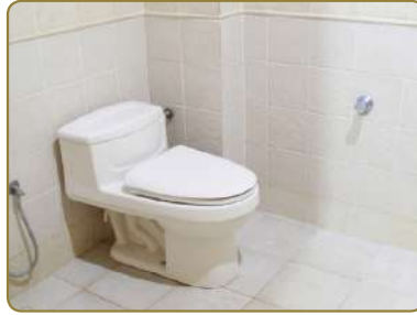
نَحَافِظُ عَلَى نِظَافَةِ دَوَّارِ الْمِيَاهِ